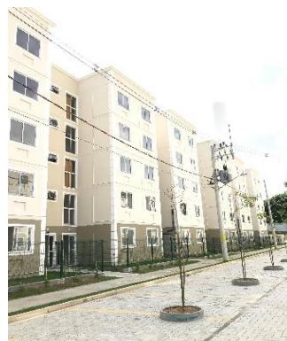
BLOCO 4C, 4B E 4A