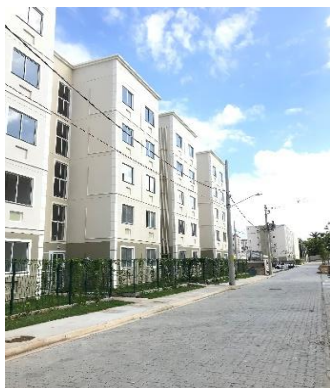
BLOCO 1A E 1B