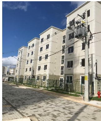
BLOCO 2A E 2B