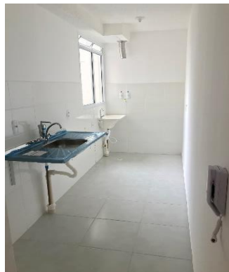
COZINHA E ÁREA DE SERVIÇO