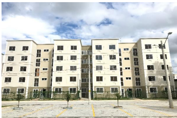
BLOCO 3A E 3B