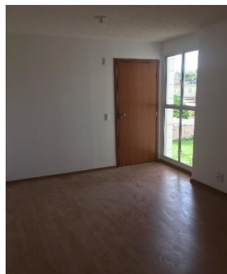
PISO LAMINADO (SALA)