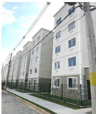
BLOCO 5A, 5B e 5C