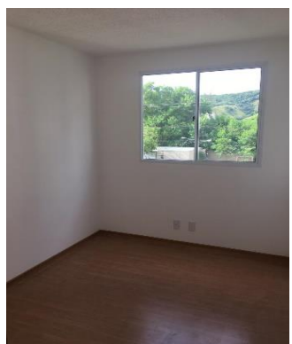
PISO LAMINADO (QUARTO 01)