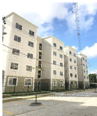
BLOCO 6A E 6B