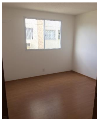
PISO LAMINADO (QUARTO 02)